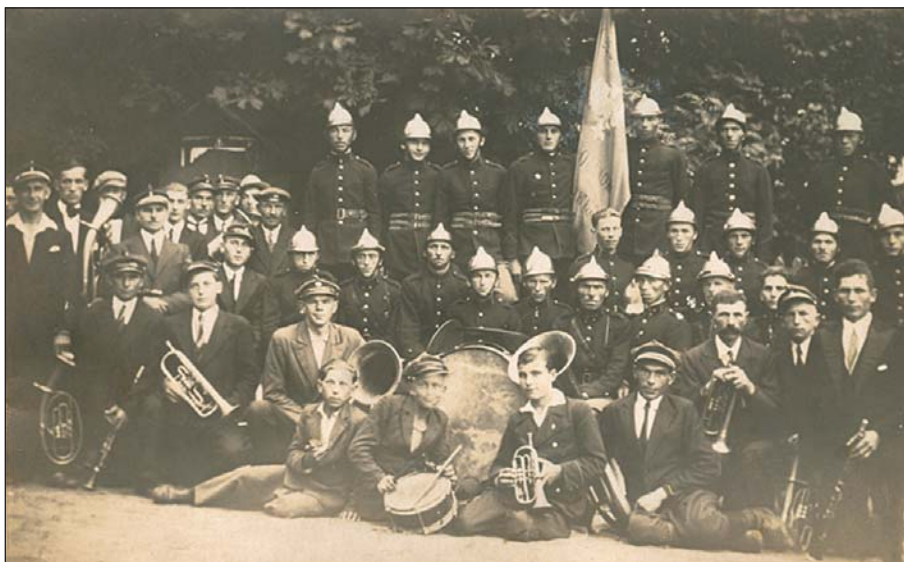
Na zdjęciu: pamiątkowa fotografia z lat 30-tych XX wieku