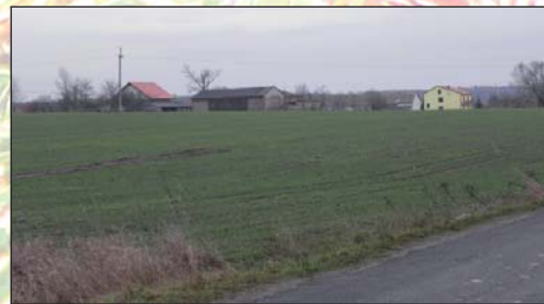
Na zdjęciu: Panorama Oprzędowa

W latach 1914-1919 nastąpiła parcelacja ziemi należącej do miejscowego folwarku, który od pierwszej połowy XIX w. był w posiadaniu rosyjskiej rodziny Markow. Wówczas 231 mórg (ok. 129,3 ha) podzielono działki po 13 mórg (ok. 7,2 ha). Miejscowi rolnicy zabudowali swe działki budynkami mieszkalnymi i gospodarczymi i z czasem powstało odrębne sołectwo - Kolonia Oprzędów.