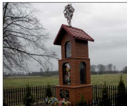
Na zdjęciu: Kapliczka przydrożna w Monikowie

Ta patronimiczna nazwa określała wieś oraz osadę karczemną leżącą w granicach gminy Łekawa, na terenie powiatu piotrkowskiego i parafii rzymsko-katolickiej w Bogdanowie. OK. 1885 r. we wsi było 10 domów oraz 105 mieszkańców do których należało 320 mórg (ok. 178,88 ha) ziemi. Do istniejącej wokół monikowskiej karczmy osady przypisanych było 13 mórg (7,26 ha) ziemi. Obecnie w miejscowości Moników mieszka 55 osób.