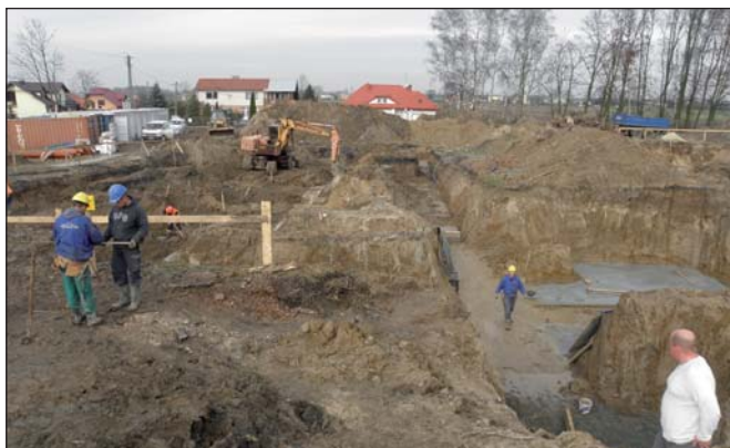
Na zdjęciu: I etap prac – roboty ziemne.

W dniu 13 października br. o godz. 14.00 całe środowisko lokalne było świadkiem historycznego wydarzenia – wmurowania AKTU EREKCYJNEGO pod Wielofunkcyjny Kompleks Oświatowy w Gomulinie, które stało się najważniejszą częścią obchodzonego w tym dniu Święta Szkoły. Był to Dzień Edukacji Narodowej, więc uroczystość rozpoczęto od ślubowania pierwszoklasistów i ich pasowania na uczniów Szkoły Podstawowej w Gomulinie. Wśród zgromadzonych gości znaleźli się przedstawiciele władz samorządowych, kościoła, całego lokalnego środowiska, nauczyciele i pracownicy obecnej szkoły