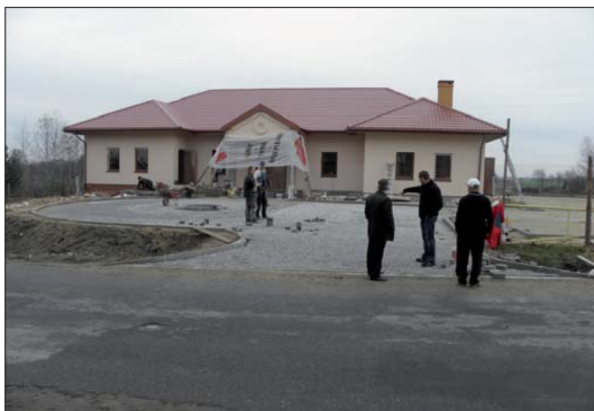
Na zdjęciu: końcowy etap robót przy budowie DL w Budkowie, zdjęcie wykonane w listopadzie 2009 r.

Grudzień jest najpracovitszym miesiącem dla służb gminnych obsługujących inwestycje. Dobiega końca realizacja większości zleconych w ramach tegorocznego budżetu inwestycji. Odebrano już m.in. roboty budowlane polegające na budowie Domu Ludowego w miejscowości Siomki oraz w sołectwie Mzurki-Budków.