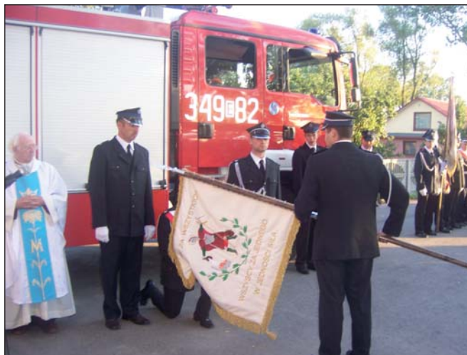
Na zdjęciu: moment przyjęcia nowego sztandaru przez jednostkę OSP Gomulin w dniu 01.09.2009 r.