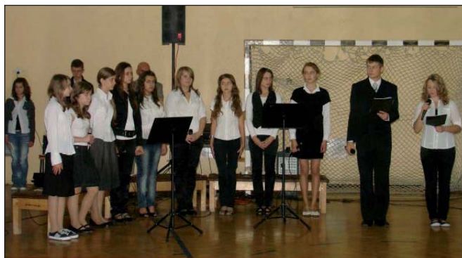
Na zdjęciu: młodzież klas I w montażu słowno-muzycznym