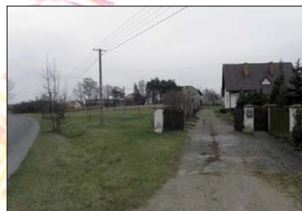
Na zdjęciu: Miejscowość Mzurki

Na dzień dzisiejszy Mzurki zamieszkuje 143 osoby.