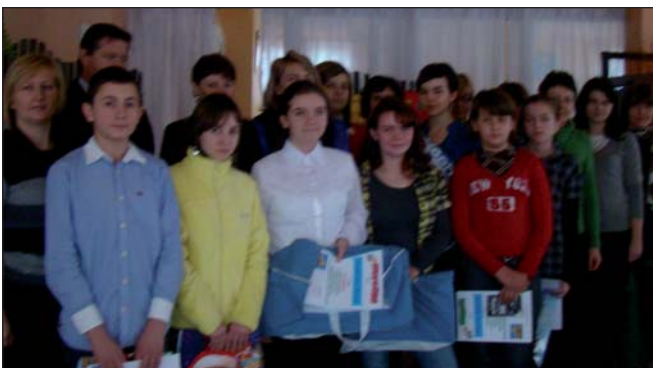
Na zdjęciu: laureaci konkursu literackiego.

Gminna Komisja Rozwiązywania Problemów Alkoholowych w Woli Krzysztoporskiej zorganizowała po raz 12 konkurs literacko – plastyczny o tematyce antyalkoholowej, skierowany do uczniów klas IV – VI oraz klas I – III gimnazjum z terenu Gminy. Celem konkursu było uświadomienie młodzieży szkolnej zagrożeń wynikających ze spożywania alkoholu oraz przybliżenie aspektów zdrowotnych, moralnych i społecznych alkoholizmu. Swoją udział w konkursie zgłosiło 8 szkół podstawowych oraz gimnazjum, wpłynęło 28 prac plastycznych oraz 21 prac literackich. Najlepsi otrzymali dyplomy i cenne nagrody (MP4, torby i plecki sportowe, portfele), pozostali uczestnicy nagrody pocieszenia w postaci pamięci USB, a każda ze szkół pamiętkowy dyplom i piłkę.