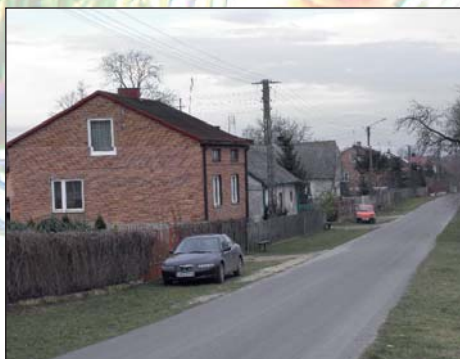
Na zdjęciu: Zabudowania w miejscowości Moników