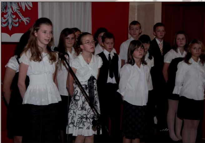
Na zdjęciu: występ młodzieży szkolnej

Na jubileusz szkoły, który odbył się 14 października, przybyło wielu gości: władze gminne, powiatowe i oświatowe, byli nauczyciele szkoły, a także uczniowie pierwszego rocznika. Były wspomnienia, występy młodzieży, zwiedzanie mocno zmienionej szkoły, a później czas na rozmowy przy wspólnym posiłku.