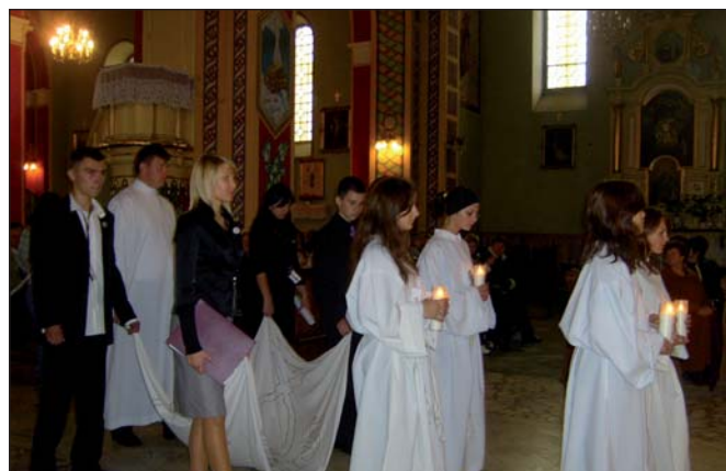
Na zdjęciu: młodzież w przedstawieniu „Wolność jest w nas”

każdy z nas, aby być naprawdę wolnym. Przed kościołem można było skosztować potraw przygotowanych przez członkinie z Koła Gospodyń Wiejskich. Wieczorem o godz. 17 - w godzinę wyboru Korola Wojtyły na papieża, odprawiono nabożeństwo, odmówiony został także różaniec w intencji beatyfikacji Jana Pawła II oraz Apel Jasnogórski.