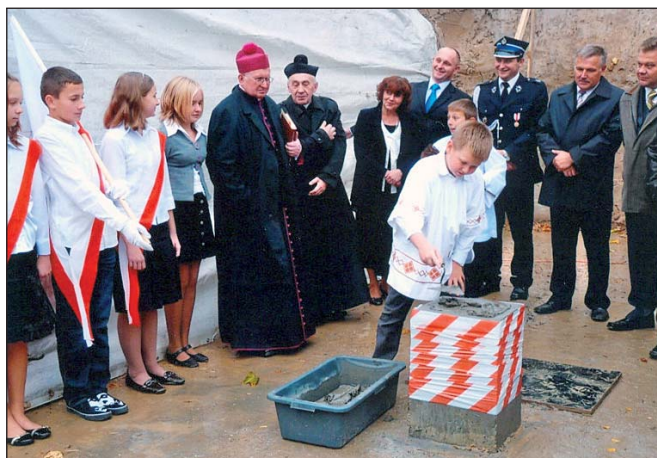
Na zdjęciu: moment wmurowania aktu erekcyjnego chwili – zwińczały bowiem 10-letnie zabiegania o rozbudowę placówki.

Następnie został podpisany przez wszystkich uczestników uroczystości, a później poświęcony i umieszczony w specjalnej tubie razem z fotografiami uczniów i pracowników szkoły, tarczą szkolną, drobnymi monetami oraz egzemplarzem biuletynu „Nasza Gmina” i gazetki szkolnej „Bratek”.