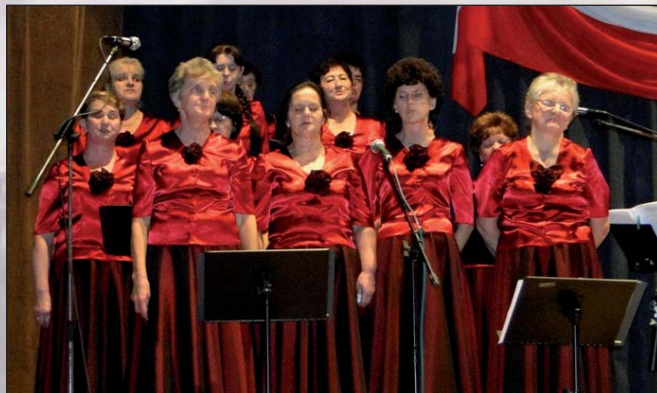
Na zdjęciu: zespół „Pasjonatki”