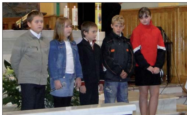
Na zdjęciu: uczniowie Szkoły Podstawowej w Bogdanowie