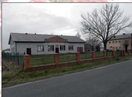
Na zdjęciu: Dom Ludowy w Oprzędowie

Po raz pierwszy nazwa wsi jest wymieniona 1398 r. gdy w dokumentach piotrkowskiego wójtostwa wspomniano Opranzow lub Oprzanczow. W zachowanych zapiskach z XVI w. odnajdujemy informację, że wieś należała do opata klasztoru Norbertanów w Witowie i tam oddawano dziesięcinę, natomiast piotrkowski proboszcz miał prawo jedynie do kolędy od mieszkańców Oprzędowa. Wieś była związana zależnością wobec opactwa do 1797 r.,