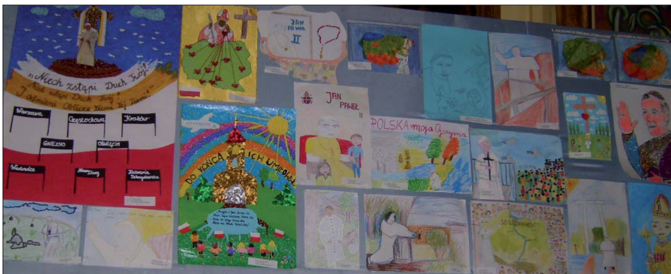
Na zdjęciu: prace nagrodzone w konkursie plastycznym

Tegoroczne Dni Papieskie w naszej Gminie zorganizowane zostały 11 i 12 października w kościele parafialnym w Bogdanowie pod hasłem „Jan Paweł II – Papież Wolności”. Rozpoczęła je uroczysta Msza Święta o godzinie 11: 30. Przed jej rozpoczęciem można było posłuchać występu Pań z Koła Gospodyń Wiejskich z Bogdanowa. Po zakończeniu mszy, w bloku słowno-muzycznym zatytułowanym „Wolność jest w nas” zaprezentowała się młodzież. Podczas występu wykonane zostały liczne pieśni poświęcone Janowi Pawłowi II oraz przedstawienie artystyczne ukazujące istotę prawdziwej wolności i drogę, jaką powinien podążać