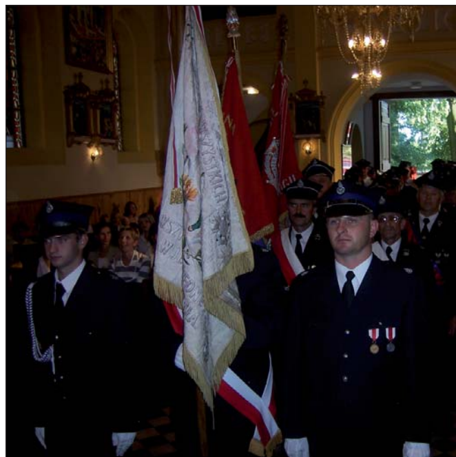
Na zdjęciu: w pierwszym rządzie poczet sztandarowy OSP Gomulin ze starym, historycznym sztandarem ( zdjęcie z 01.09.2009 r.)