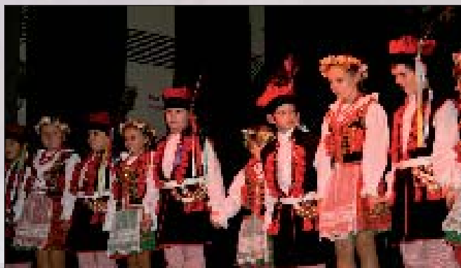
Na zdjęciu: zespół „Skrzaty” z Woźnik

W dalszej części Gali na scenie zaprezentowała swój repertuar Orkiestra Dęta z Gomulina. Na początek występu muzyki