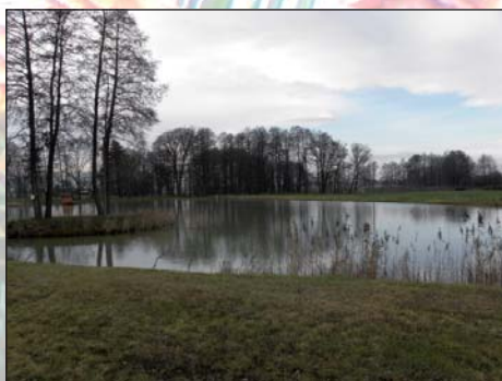
Na zdjęciu: Staw w Mzurkach

Dziewiętnastowieczne opisy wymieniają pod tą nazwą wieś wraz z folwark