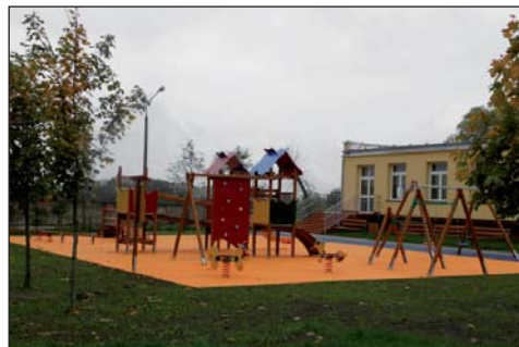
Na zdjęciu: plac zabaw przy SP w Woli Krzysztoporskiej

W sierpniu zakończyła się długo oczekiwana budowa placu zabaw przy Szkole Podstawowej w Woli Krzysztoporskiej. Ta największa na terenie Gminy, licząca 300 uczniów szkoła podstawowa, nie miała dotychczas takiego obiektu. Dlatego podjęto decyzję o wybudowaniu placu zabaw o wysokim standardzie, który będzie służył uczniom przez wiele lat i będzie odpowiadał europejskim wymaganiom. Wykonano projekt obiektu i wyłoniono w przetargu nieograniczonym wykonawcę. Najniższa zaoferowana kwota za jego wykonanie wyniosła 230.000,00 zł z tego kwota 115.000,00 zł została sfinansowana z środków Ministerstwa Sportu i Turystyki a pozostała z środków własnych Gminy. We wrześniu obiekt zostanie oddany do użytkowania.