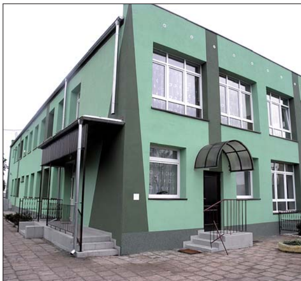
Na zdjęciu: budynek Przedszkola Samorządowego w Woli Krzysztoporskiej

W okresie wakacyjnym przeprowadzono kompleksowe działania termomodernizacyjne w Przedszkolu Samorządowym w Woli Krzysztoporskiej. W ramach inwestycji wykonano: instalację powietrznej pompy ciepła, roboty ogólnobudowlane tj. ocieplenie fundamentów, ścian zewnętrznych oraz stropodachu, wymianę stolarki okiennej i drzwiowej, wymianę orywnowania oraz instalacji odgromowej, wymianę instalacji centralnego ogrzewania, remont kotłowni: wymiana kotła węglowego na kocioł olejowy).