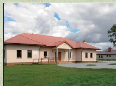
Na zdjęciu: Dom Ludowy w miejscowości Siomki

W chwili obecnej w Siomkach mieszkają 452 osoby.