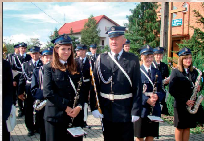
Na zdjęciu obok: orkiestra dęta z OSP Gomulin

Po zakończeniu mszy nastąpiło przejście korowodu dożynekowego na boisko sportowe przy ZSR CKP w Bujnach,