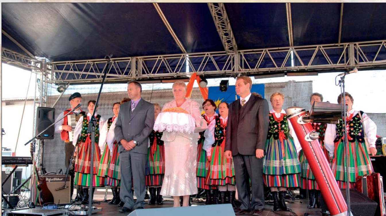
Na zdjęciu: Wójt Gminy Wola Krzysztoporska i starostwie dożynek, z tyłu - „Ludowe Pasjonatki”

Już od wielu lat dożynki są tradycyjnym świętem, podczas którego rolnicy dziękują za zebrane plony. Są też okazją do wypoczynku i dobrej zabawy po pełnej wysiłku pracy na roli. Tegoroczne Gminne Dożynki odbyły się 29 sierpnia w miejscowości Bujny. Ich organizatorem był Wójt Gminy Wola Krzysztoporska, Rada Gminy oraz Gminny Ośrodek Kultury.