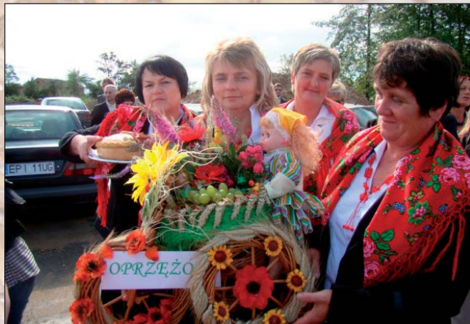
Na zdjęciu: KGW Oprzęzów z wieńcem dożynkowym