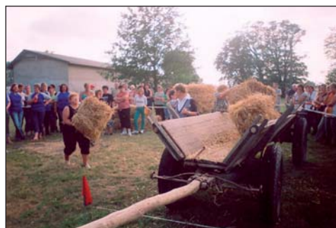
Na zdjęciu: w konkurencji na przewóz furmanką beli słomy trzeba się było wykazać niemałą krzepą