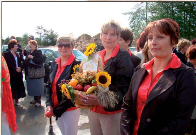
Na zdjęciu: KGW Majków Duży z wieńcem dożynkowym

Zwieńczeniem Święta Plonów była oczekiwana przez wielu przybyłych gości zabawa taneczna „pod gwiazdami” przy akompaniowaniu zespołu muzycznego „Red Dance”. Mimo, iż pogoda wieczorem nie była sprzyjająca, zespołowi udało się przekonać publiczność do wspólnej zabawy.