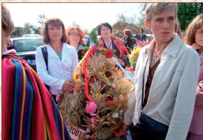
Na zdjęciu: KGW Kozierogi z wieńcem dożynkowym