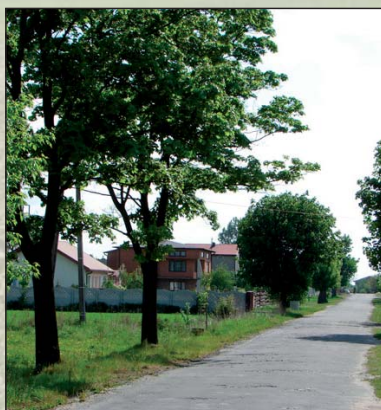
Na zdjęciu: zabudowania w Siomkach