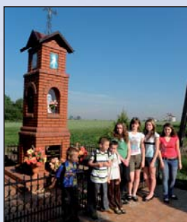
Na zdjęciu: dzieci z Radziątkowa czekające na autobus szkolny obok przydrożnej kapliczki