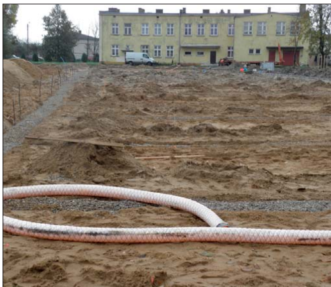
Na zdjęciach: plac budowy zespołu boisk o sztucznej nawierzchni przy Szkole Podstawowej w Bujnach w ramach programu „Moje Boisko – Orlik 2012”

W sierpniu rozpoczęły się prace przy budowie zespołu boisk o sztucznej nawierzchni w miejscowości Bujny w ramach programu rządowego „Moje Boisko – Orlik 2012”. Koszt robót budowlanych to kwota 1 097 959,13 zł i obejmuje on wykonanie: boiska wielofunkcyjnego o nawierzchni poliuretanowej, boiska o nawierzchni z trawy syntetycznej do gry w piłkę nożną, budynku szatniowego, oświetlenia i ogrodzenia terenu, zbiornika na ścieki ogólnie spławne oraz robót rozbiórkowych (rozbiórka budynku gospodarczego). Na realizację zadania Gmina Wola Krzysztoporska uzyskała dofinansowanie w łącznej kwocie 666 667,00 zł ze środków pozostających w gestii Ministerstwa Sportu i Turystyki oraz Urzędu Marszałkowskiego w Łodzi. Oddanie obiektu do użytkowania planowane jest w listopadzie 2010 r. ❖