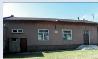
Na zdjęciu: Dom Ludowy w miejscowości Rokszyce

Obecnie w Rokszycach I mieszka 199 osób a w Rokszycach II - 186 osób.