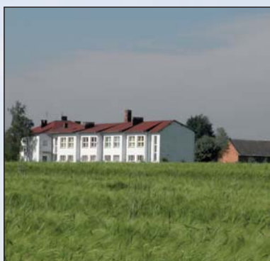
Na zdjęciu: szkoła w Rokszycach