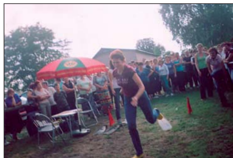
Na zdjęciu: bieg z płetwami – najbardziej atrakcyjna konkurencja