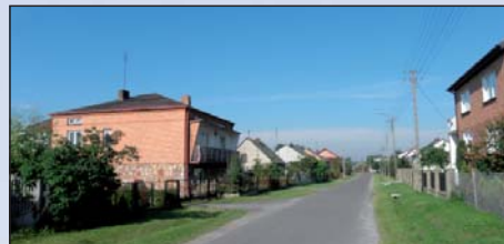
Na zdjęciu: zabudowania miejscowości Radziątków

Obecnie Radziątków zamieszkują 242 osoby.