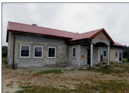
Na zdjęciu: Dom Ludowy w Pawłowie Górnym