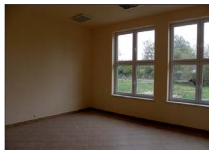
Na zdjęciu: wnętrze Domu Ludowego w Kozierogach po remoncie