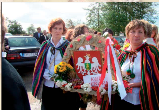
Na zdjęciu: KGW Piekarki z wieńcem dożynkowym