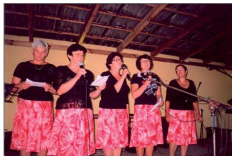
Na zdjęciu: zdobywczynie III m-sca w konkursie piosenki biesiadnej i najlepszego dowcipu - KGW Mąkolice

Impreza przebiegała w miłej i spontanicznej atmosferze, czas konkursu umilała wszystkim Kapela „Spod Dębu” z Mzurek. Rywalizującym zawodniczkom trudno odmówić uroku osobistego i wdzięku. Trudno też nie zgodzić się ze słowami Wójta Gminy, że „Panie z Kół Gospodyń Wiejskich to sól naszej pięknej Ziemi Wolskiej”.