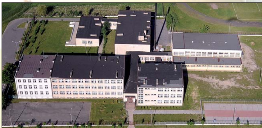
Zdjęcie lotnicze, wykonane w 2008 roku, pokazujące obiekt przed kompleksową termomodernizacją

W pierwszym naborze wniosków o dofinansowanie projektów (ogłoszonym w 2008 roku), w ramach Osi priorytetowej II Ochrona środowiska, zapobieganie zagrożeniom i energetyka, Działanie II.6 Ochrona powietrza, Regionalnego Programu Operacyjnego Województwa Łódzkiego na lata 2007-2013, wniosek Gminy przeszedł pomyślnie wszystkie szczeble oceny, lecz nie otrzymał dofinansowania z uwagi na brak środków (znalazł się na 8 miejscu listy rankingowej – dofinansowanie otrzymało pięciu wnioskodawców). Wtedy złożone zostały 53 wnioski na łączną wartość blisko 120 mln zł (na konkurs przeznaczono 8,5 mln zł). Kolejny nabór ogłoszono