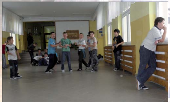
Dzięki pieniądzom unijnym w I etapie dokonano wymiany stolarki okiennej a w III – m. in. wymiany grzejników. Zdjęcie wykonane w trakcie przerwy międzylekcyjnej.