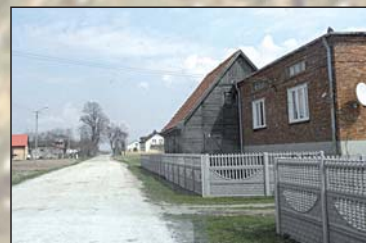
Na zdjęciu: zabudowania w miejscowości Stradzew

We wsi mieszkało 97 osób, które zajmowały 10 domów. W przyległym do wsi folwarku w 3 domach mieszkało 11 osób. W 1886 r. folwark stradzewski stanowił część majątku dziedzica z Postękalic. Dwór w Stradzewie użytkował ziemie o ogólnej powierzchni 471 mórg