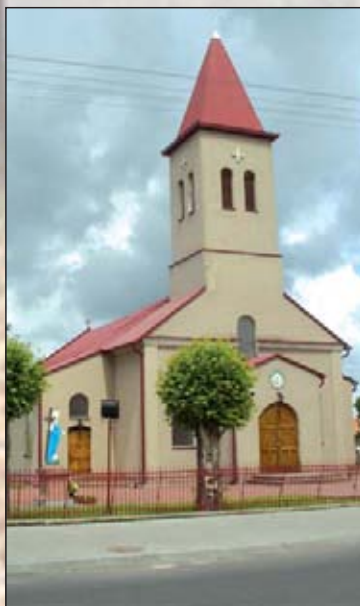
Na zdjęciu: Kościół p.w. Najświętszego Serca Pana Jezusa w Woli Krzysztoporskiej

W dziewiętnastowiecznych opisach odnajdujemy pod tą nazwą wieś wraz z folwarkiem leżącą na terenie parafii Bogdanów w granicach administracyjnych gminy Krzyżanów oraz powiatu piotrkowskiego w odległości 12 wiorst (ok. 12,8 km) od stolicy powiatu oraz 1,5 wiorst (ok. 1,6 km) od sąsiedniego Jeżowa.