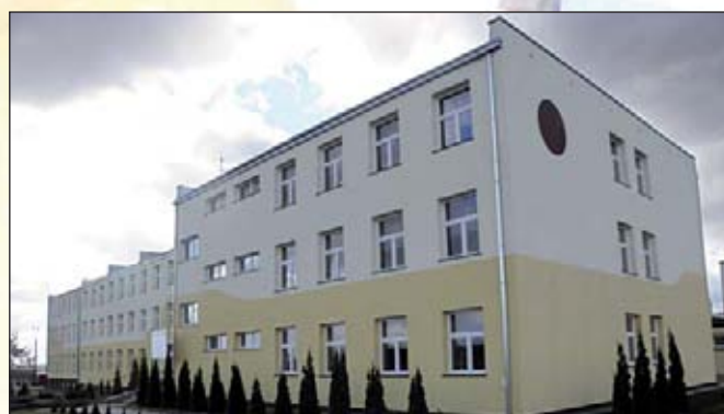
Powyżej zdjęcia szkoły przed i po modernizacji

w sierpniu 2009 roku. Cieszył się on jeszcze większym zainteresowaniem. Tym razem do Urzędu Marszałkowskiego w Łodzi wpłynęło 118 wniosków na łączną wartość ponad 303 mln zł, przy czym do rozdysponowania przeznaczono kwotę 28 mln zł. Projekt Gminy Wola Krzysztoporska znalazł się na 16 miejscu listy projektów zakwalifikowanych do dofinansowania. W efekcie w czerwcu 2010 roku podpisano umowę o dofinansowanie realizacji projektu. Wysokość dofinansowania ze środków UE wyniosła 85% wydatków kwalifikowalnych inwestycji.