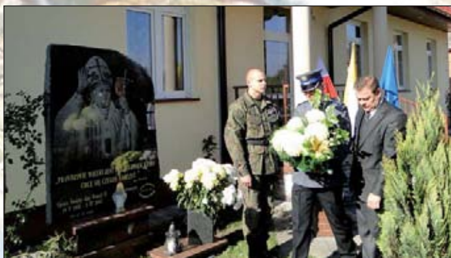
Na zdjęciu: moment składania wiązanki kwiatów pod pomnikiem Jana Pawła II przy Szkole Podstawowej w Bogdanowie