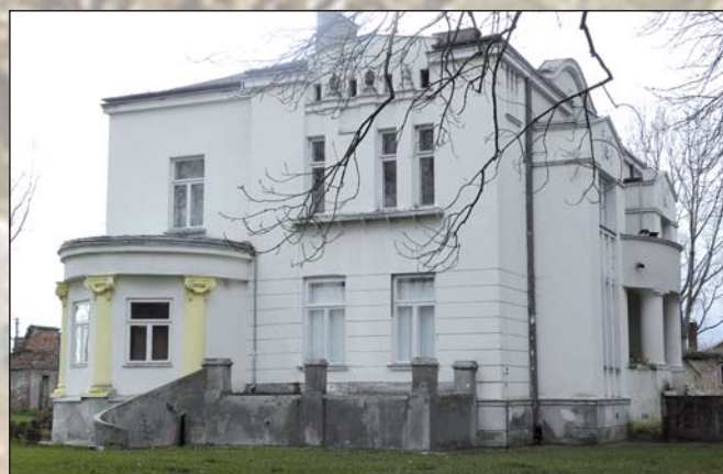
Na zdjęciu: zabytkowa willa z początków XX w. – Wola Krzysztoporska

Wola Krzysztoporska była centrum rozległego majątku składającego się z folwarków w Woli Krzysztoporskiej i Krężnej, karczm w Woli Krzysztoporskiej. W 1885 r. ogólna powierzchnia wolskiego dominium wynosiła 1868 mórg (1045,70 ha) ziemi. Znaczna część przypadała na folwark Wola Krzyszto-