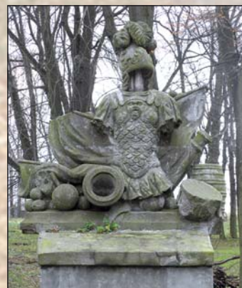
Na zdjęciu: zabytkowy rycerz (pozostałość po bramie wjazdowej do dworu Krzysztoporskich)

Obecnie miejscowość Wola Krzysztoporska liczy 2055 mieszkańców.