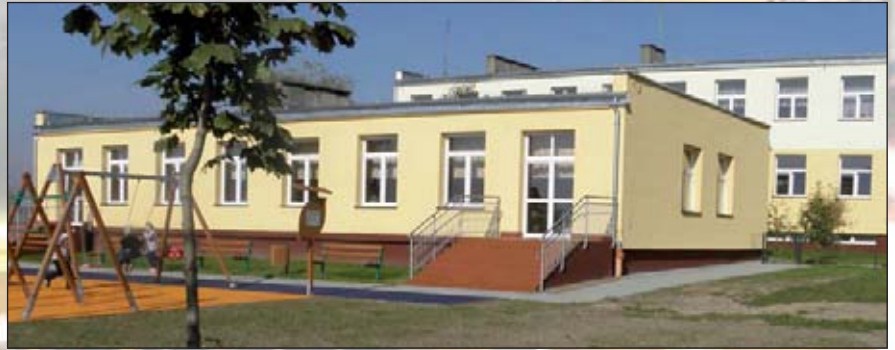
Powyżej zdjęcia bloku przedszkolnego w trakcie i po termomodernizacji