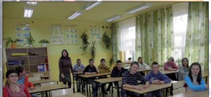
Projekt, oprócz prac termomodernizacyjnych, obejmował wymianę opraw oświetleniowych oraz roboty malarskie. Obecnie dzieci i młodzież uczą się w lepszych warunkach – w doświetlonych i ładniejszych klasach. Na zdjęciu jedna z klas lekcyjnych.