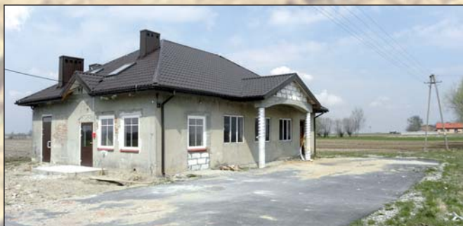
Na zdjęciu: Dom Ludowy w Stradzewie

Dziewiętnastowieczny podział administracyjny lokował tę wieś w powiecie piotrkowskim, gminie Woźniki na terenie parafii pw. św. Wojciecha w Krzeczczowie, w odległości 14 wiorst (ok. 14,93 km) od stolicy powiatu.