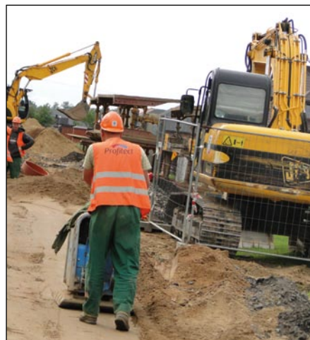
Na zdjęciach: prace przy budowie kanalizacji sanitarnej w miejscowości Siomki na ul. Spacerowej i ul. Wesolej