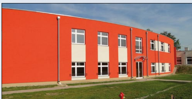
Na zdjęciach: Kolejne etapy budowy nowego gimnazjum (od lewej): zdjęcie wykonane w lipcu 2010 roku, następnie – w lutym 2011 i stan obecny