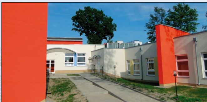
Zdjęcia pokazują wejście do bloku przedszkolnego w trakcie budowy i po zakończeniu prac

W dniu 30 sierpnia 2011 roku uzyskano decyzję o pozwoleniu na użytkowanie obiektu oświatowego w Gomulinie. W skład kompleksu wchodzi: przedszkole, rozbudowana szkoła podstawowa, pawilon zerówek, gimnazjum, sala gimnastyczna, zespół żywieniowy, nowoczesna kotłownia na olej opałowy z zamontowaną pompą ciepła, plac zabaw, parkingi. W budynku wykorzystano część wyposażenia ze zlikwidowanych szkół podstawowych w Woźnikach i Rokszycach. Dokonano również zakupu nowego wyposażenia - głównie