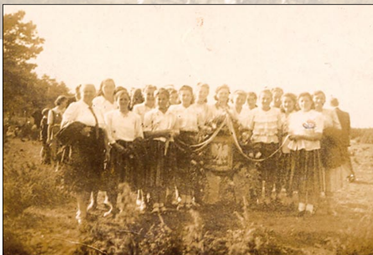
Dożynki – rok 1951