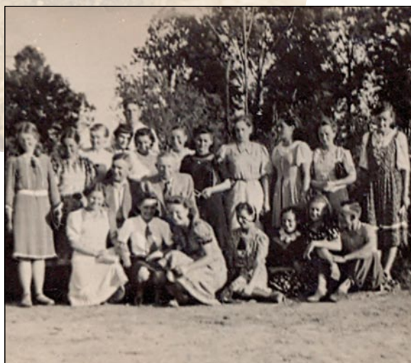
Kurs rolniczy w Milejowie – 12 lipca 1962 roku