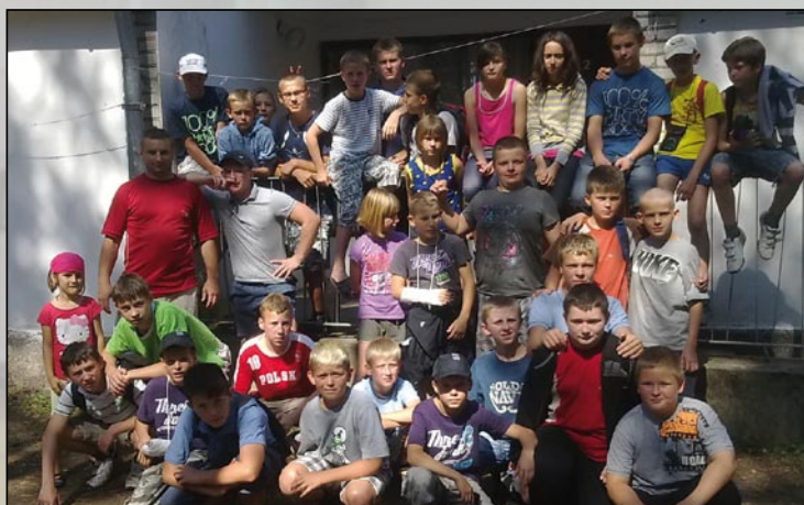
Na zdjęciu: Uczestnicy obozu sportowego w Janowie Lubelskim

Zarząd Klubu LUKS „ATHLETIC” Wola Krzysztoporska dziękuje wszystkim instytucjom publicznym i sponsorom pry-