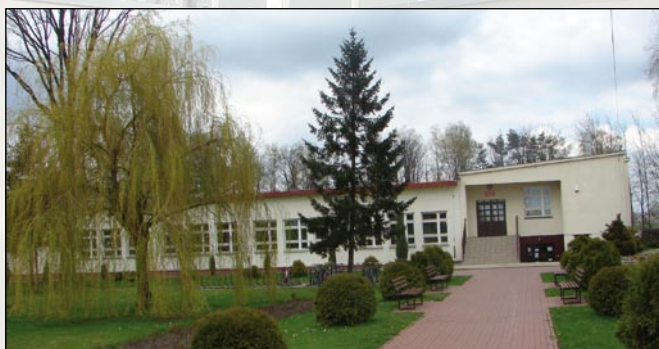
Zdjęcie szkoły przed rozbudową (wiosna 2008)

W związku z uruchomieniem nowej placówki oświatowej zostanie przeorganizowany również system dojazdów do szkół gminnych. Prawidłowe zorganizowanie dojazdów jest niezwykle skomplikowanym procesem, a wiele problemów związanych ze zmianami ujawni się zapewne dopiero po ich wprowadzeniu. Dlatego dzieci dojeżdżające do szkół oraz ich rodzice proszeni są o wyrozumiałość, szczególnie w pierwszych dniach roku szkolnego, kiedy to mogą występować nieprawidłowości takie jak opóźnienia czy nieregularny ruch autobusów. Z doświadczenia wiadomo, że problemy te zostaną w krótkim czasie pokonane, a nowe rozwiązania zaczęną funkcjonować należycie. Potrzebne na to będzie jednak trochę czasu.