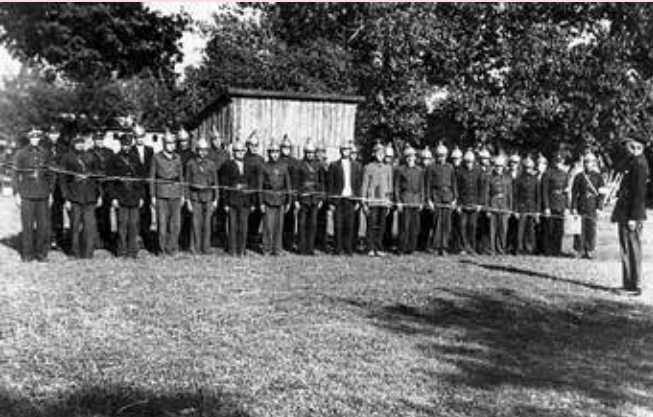
Oddział Straży w Krzyżanowie – lata 30. ubiegłego stulecia