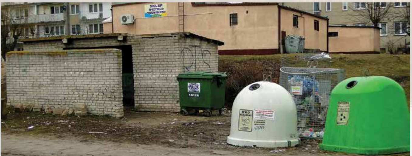
Śmietnik osiedlowy w Woli Krzysztoporskiej

5. Należy podkreślić, że nowe zasady dotyczą wyłącznie odpadów komunalnych powstających na nieruchomościach zamieszkałych. Przez określenie odpady komunalne należy rozumieć odpady z gospodarstw domowych. Odpady powstające poza gospodarstwami domowymi np. związane z procesami wytwórczymi w przemyśle, usługach czy rolnictwie nie są objęte systemem, a ich odbiór i zagospodarowanie odbywać się będzie na dotychczasowych zasadach (indywidualne umowy z firmami odbierającymi odpady).