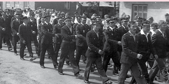
Zdjęcia z otwarcia nowowybudowanej strażnicy w Krzyżanowie – rok 1982