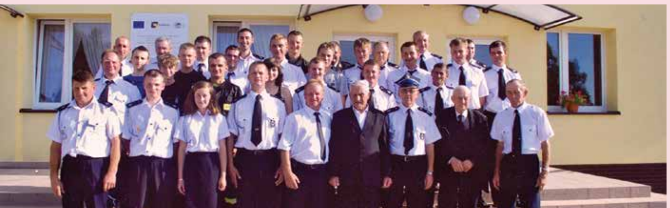
Zdjęcie z uroczystości obchodów 104 rocznicy istnienia jednostki Ochotniczej Straży Pożarnej w Krzyżanowie