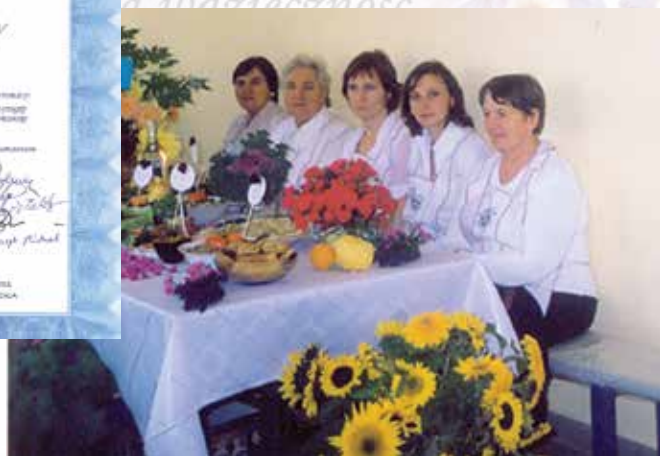
Reprezentacja KGW na jednym z konkursów kulinarnych