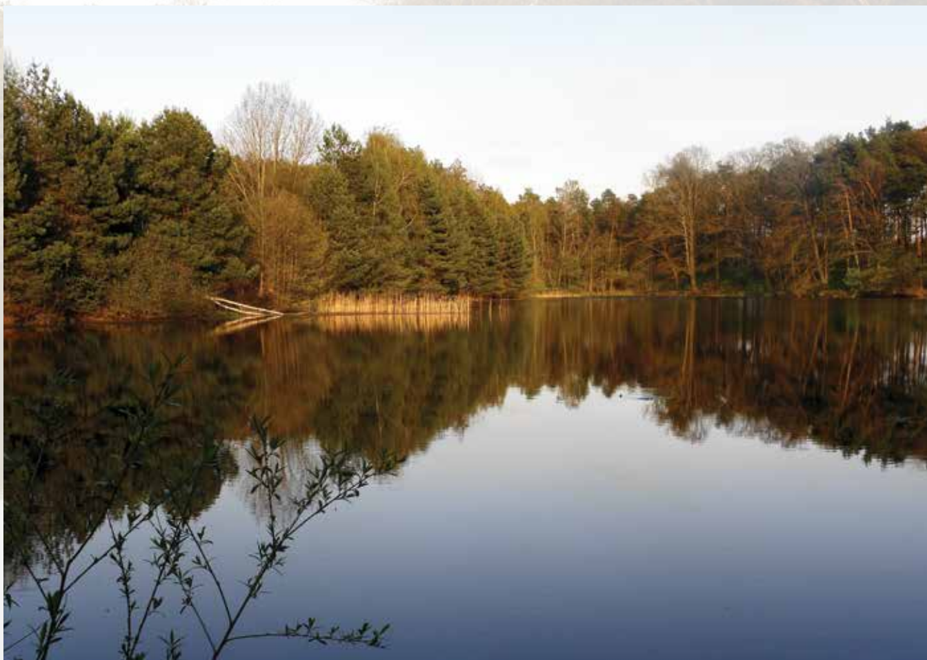
Segregacja śmieci i odpowiednio zorganizowany odbiór odpadów to dbałość o środowisko naturalne. Pozwala zachować piękno otaczającej nas przyrody – bez dzikich wysypisk. Na zdjęciu malowniczy staw w Wygodzie.

Więcej informacji na temat odbioru i zagospodarowania odpadów na nowych zasadach można uzyskać w Urzędzie Gminy w Woli Krzysztoporskiej lub na stronie internetowej Gminy www.wola-krzysztoporska.pl .