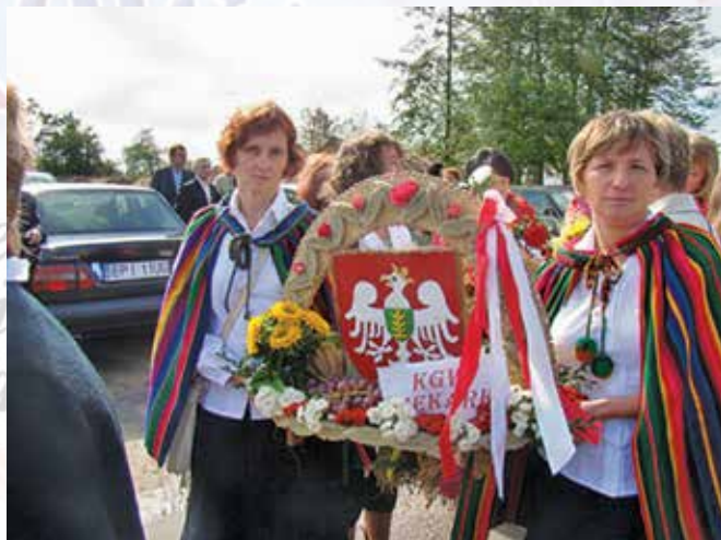
Dożynki powiatowe – Bujny 2011