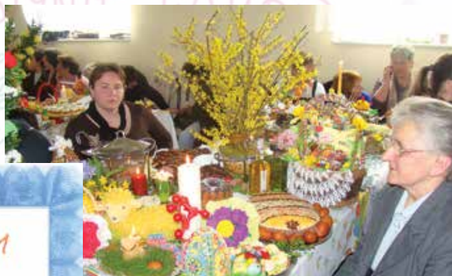
Konkurs „Tradycje Stołów Wielkanocnych” (2011 rok) – Koło otrzymało I miejsce za „Rozmarynowkę”